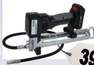
Akku-Fettpressen-Set 18-S Li-Ion