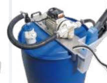
AdBlue Pumpe für 210lt Fässer