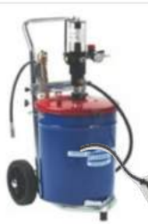
Druckluftfettpresse bis 400bar