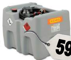
CEMO DT-Mobil Easy 210 l, CENTRI SP 30, 30 l/min