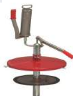
Füllgerät für 25kg