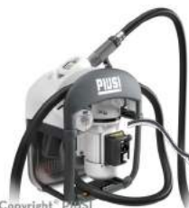
AdBlue Pumpe für Container