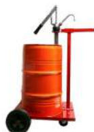
Fasswagen mit Handgetriebe- ölpumpe